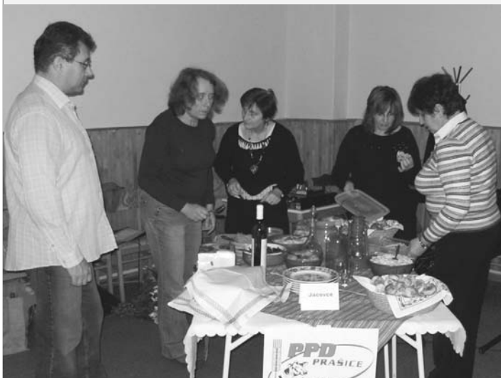
Jacovské družstvo v usilovnej príprave V Krušovciach.