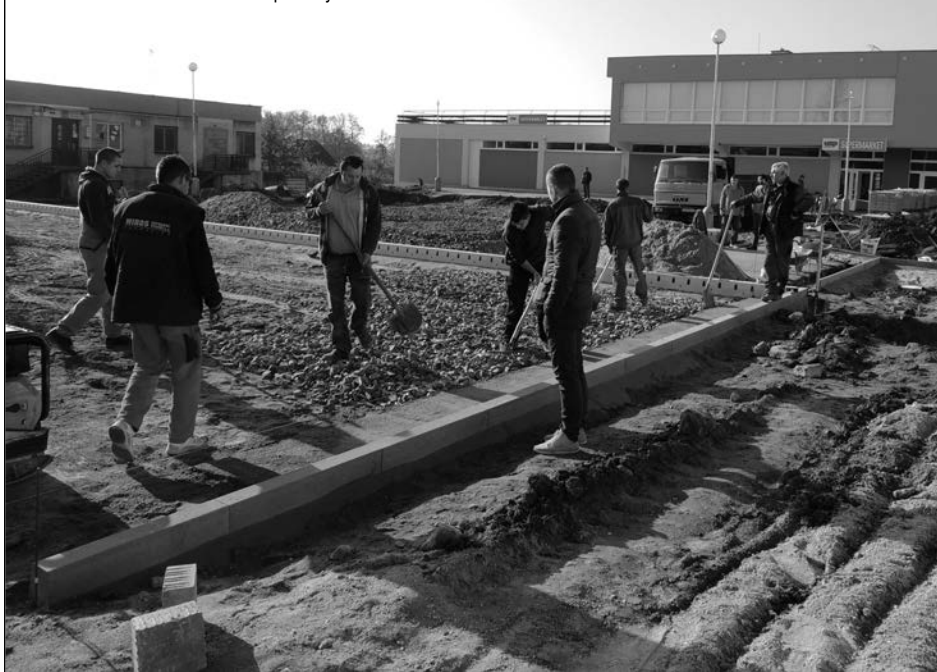
O rok bude na tomto mieste už úplne iný obrázok

rekonštrukcia lávky v riečnom kilometri 6,721 pri starom kostole cez potok Chotina. Rozpon novej lávky bude 11,76 m. Bude odstránená stredová podpera lávky. Nová lávka bude bez stredovej podpory, bude vytvorená z ocelových nosníkov, ktoré budú zvarené so všetkými časťami konštrukcie. Bude zhotovené nové zábradlie, asfaltová mostovka. Lávka bude slúžiť iba peším chodcom. K lávke bude vybudovaný nový prístupový chodník pre peších spolu s odvodňovacími rigolmi. Chodník bude vydláždený zámkovou dlažbou.