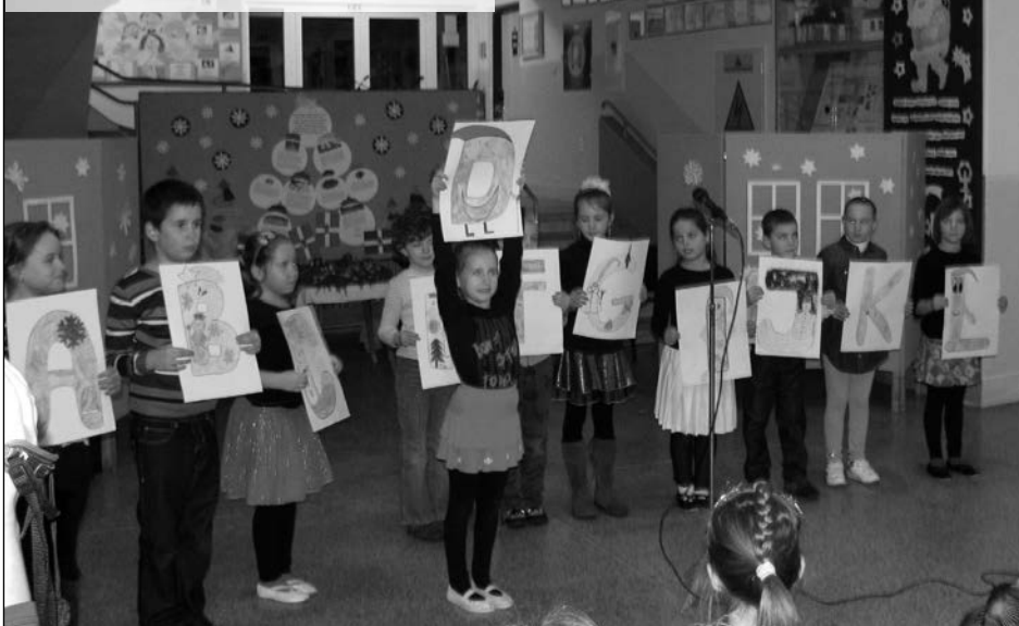
Jedna z besiedok, ktorými deti potešili svojich rodičov.