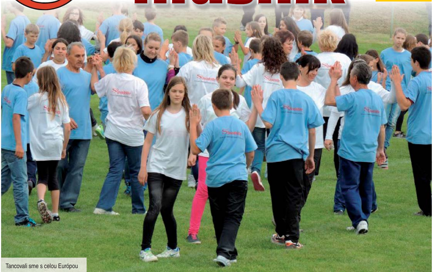
Tancovali sme s celou Európou