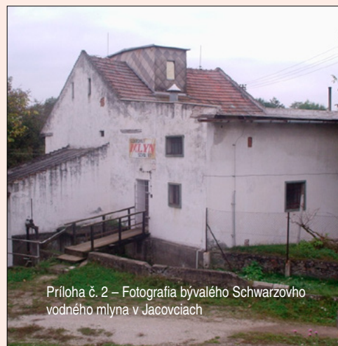
Príloha č. 2 – Fotografia bývalého Schwarzovho vodného mlyna v Jacovciach

Ludovít Schwarz mal v učňovskom pomere učňov Jána Matejoviča, Ludovíta Štukovského,