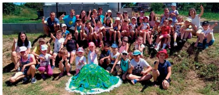
Vaši animátori eRka v Jacovciach, Pavučina radosti