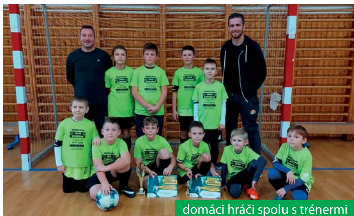
domáci hráči spolu s trénermi