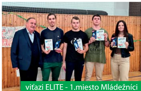
víťazi ELITE - 1.miesto Mládežníci

V kategórii ELITE získali: 1. miesto Mládežníci, 2. miesto GCM a 3. miesto Hasiči. V kategórii JUNIOR obsadili: 1. miesto BOZOVIA, 2. miesto MIMONI, 3. miesto ČIERNI TIGRI, ktorí si prevzali z rúk p. starostu vzácne trofeje, diplom a sladkosť.