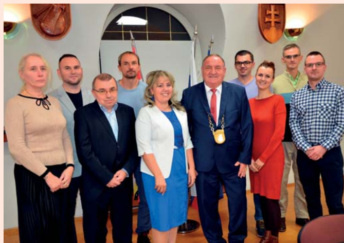
zvolení kandidáti na poslancov spolu so starostom