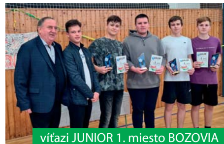
víťazi JUNIOR 1. miesto BOZOVIA